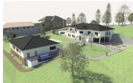
Centrum odborného výcviku – gastroobory